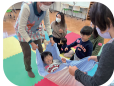
サロンによって色々なおもちゃがあります