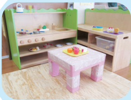
ままごとコーナー

うちの子はおままごとが大好き！家でこれだけの数を揃えるのは大変だから、ここで沢山あそびます！