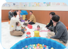
パパ向けの企画もあります

家では遊びが限られてしまうので、のびのび遊んでくれて父親としても気分転換できています。